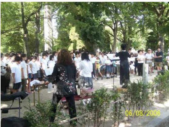
8月6日 地球ハーモニーコンサート