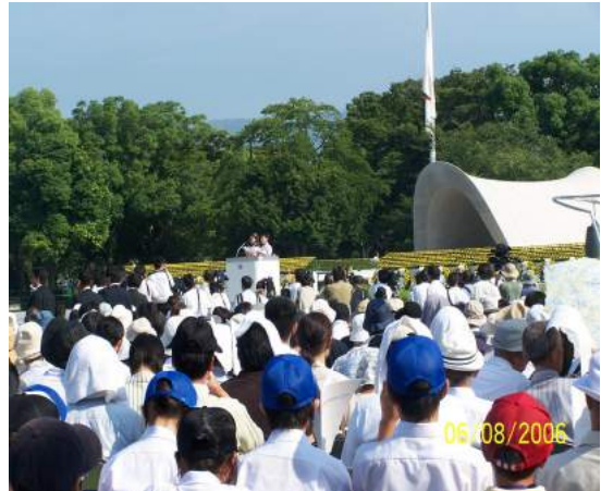
平和記念式典での平和への誓い