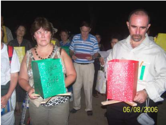
灯籠流しの歴史について語る館長