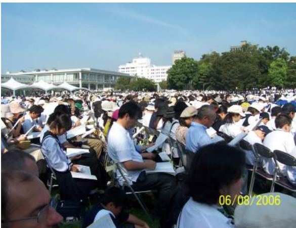
8月6日 平和記念式典